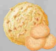
Galleta María María Biscuit