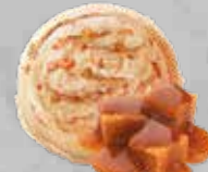
Dulce de Leche Sweet Milk