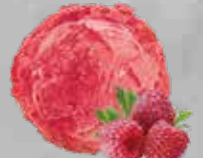
Sorbete Frambuesa Raspberry Sorbet