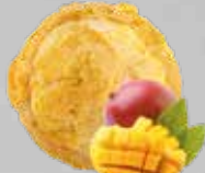
Sorbete Mango Mango Sorbet