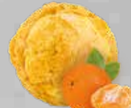
Sorbete Mandarina Mandarin Sorbet