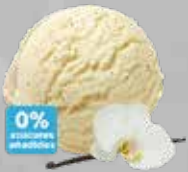
Vainilla sin azúcar Vanilla without sugar