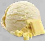
Ciocolato bianco Chocolate blanco