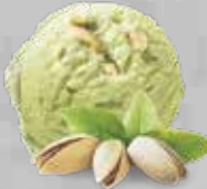
Pistaccio di Sicilia Pistacho de Sicilia