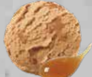
Caramelo salado Salted caramel