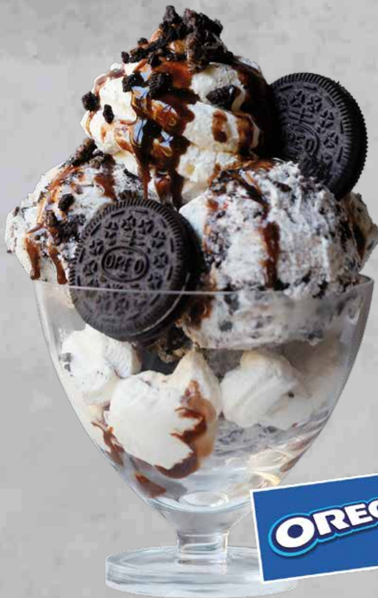
COPA OREO DREAM Helado Oreo con trocitos de galleta Oreo y galletas Oreo