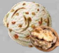
Nata Nueces Cream & Walnuts