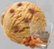
Pasas al Ron Rum & Raisins