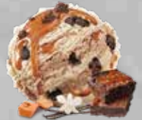
Vainilla Brownie Caramelo Vanilla Brownie Caramel