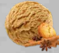
Caramelo & galleta canela Caramel & cinnamon cookie